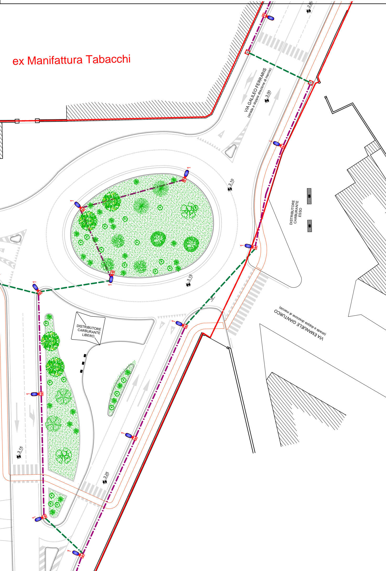
Via Emanuele Gianturco