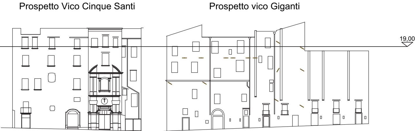
NAVIGATORE (Scala 1:500)