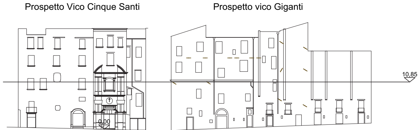
NAVIGATORE (Scala 1:500)