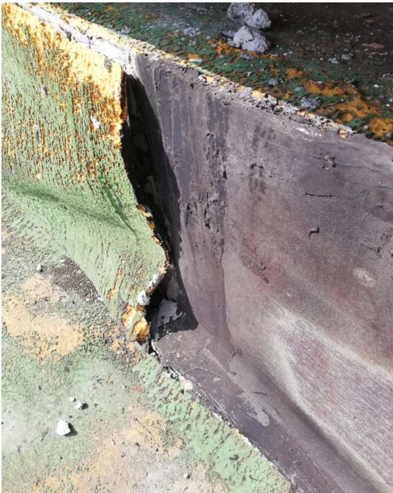
foto n.6 Stato di fatto - Stato di fatto – Particolare dell'ammaloramento dello strato poliuretano di coibentazione e della guaina bituminosa in prossimità dell'attacco solaio – muretto