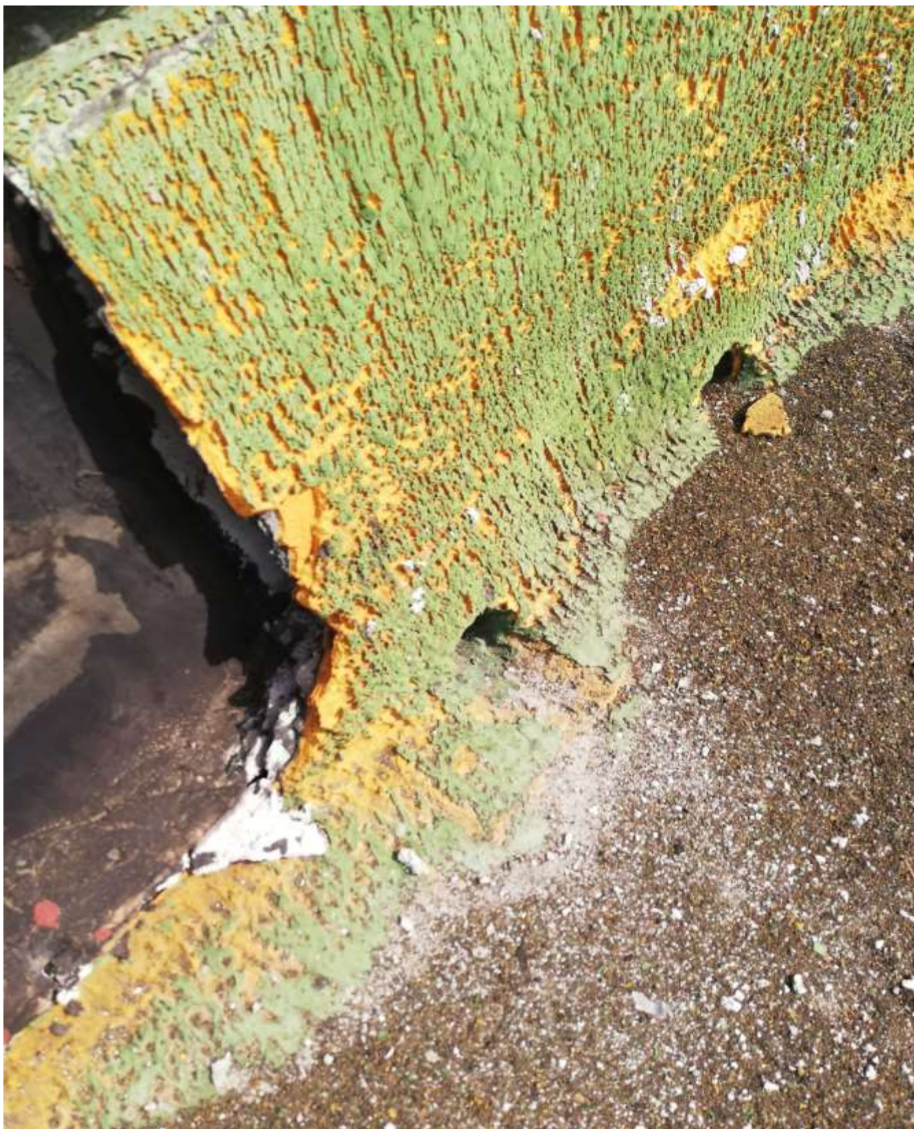
foto n.5 Stato di fatto – Particolare dell'ammaloramento dello strato poliuretanico di coibentazione e della guaina bituminosa