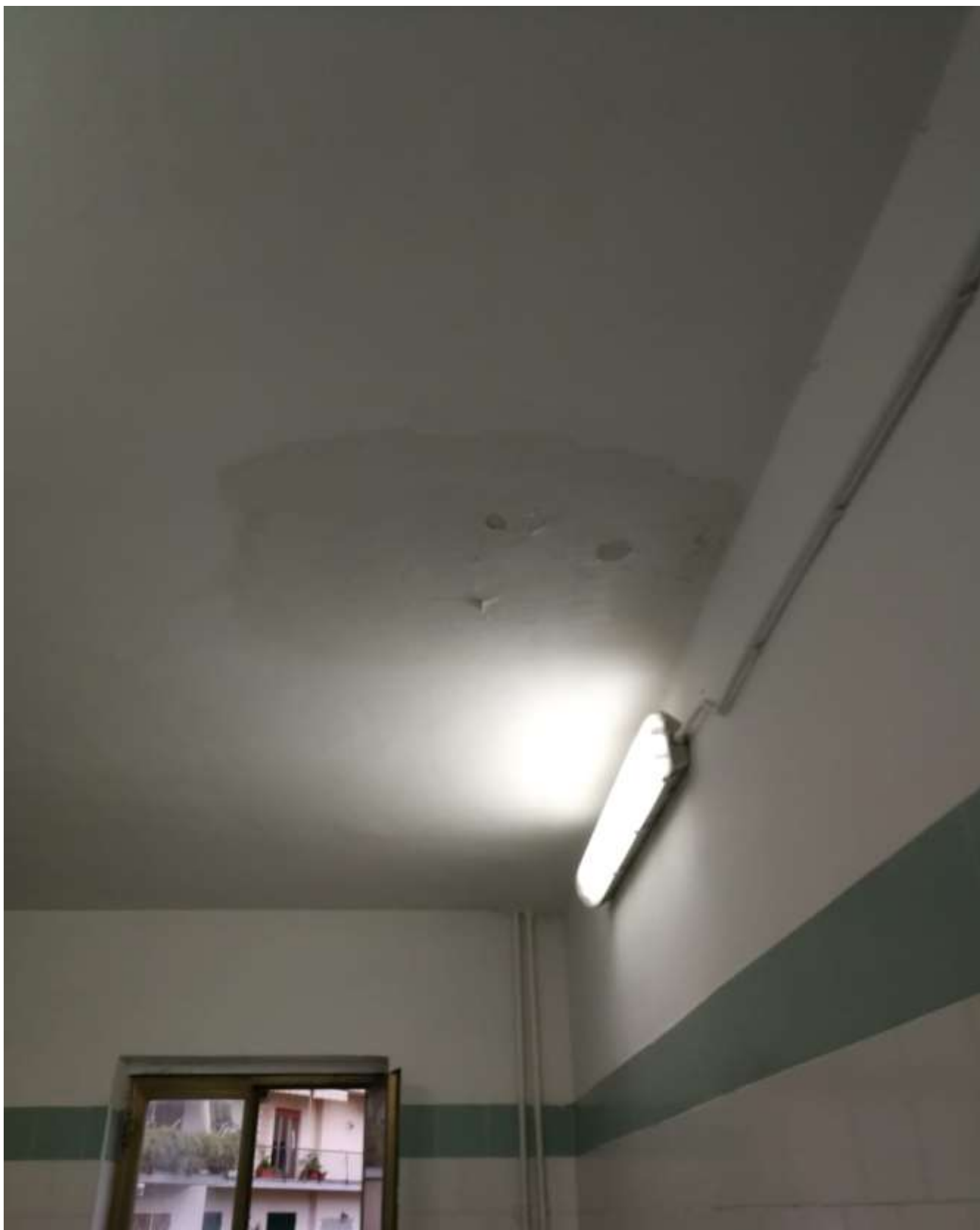
foto n.7 Stato di fatto - Stato di fatto – Particolare dell'infiltrazione di acqua piovana in prossimità dell'intradosso del solaio dell'aula al terzo piano