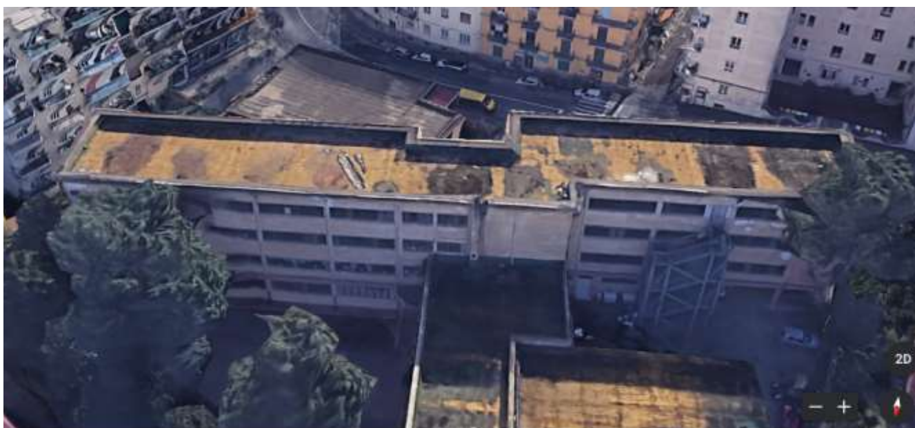
foto n.2 Vista Aerofotogrammetrica dell'istituto 21° C.D. Mameli Zuppetta – Prospetto posteriore

Il plesso scolastico è attualmente interessato da gravi infiltrazioni di acque meteoriche provenienti dal lastrico solare. Inoltre, le aule dell'ultimo piano si presentano all'intradosso dei solai rovinati in molti punti e pertanto, ne è stato interdetto il loro utilizzo. L'intervento è stato inserito come priorità per l'adeguamento degli spazi ad uso scolastico e per il ripristino delle funzionalità degli spazi interni delle scuole della terza municipalità. Le condizioni attuali non consentono di poter ripristinare l'uso scolastico originario ai fini didattici e la serena riapertura del plesso in condizioni di salubrità e sicurezza.