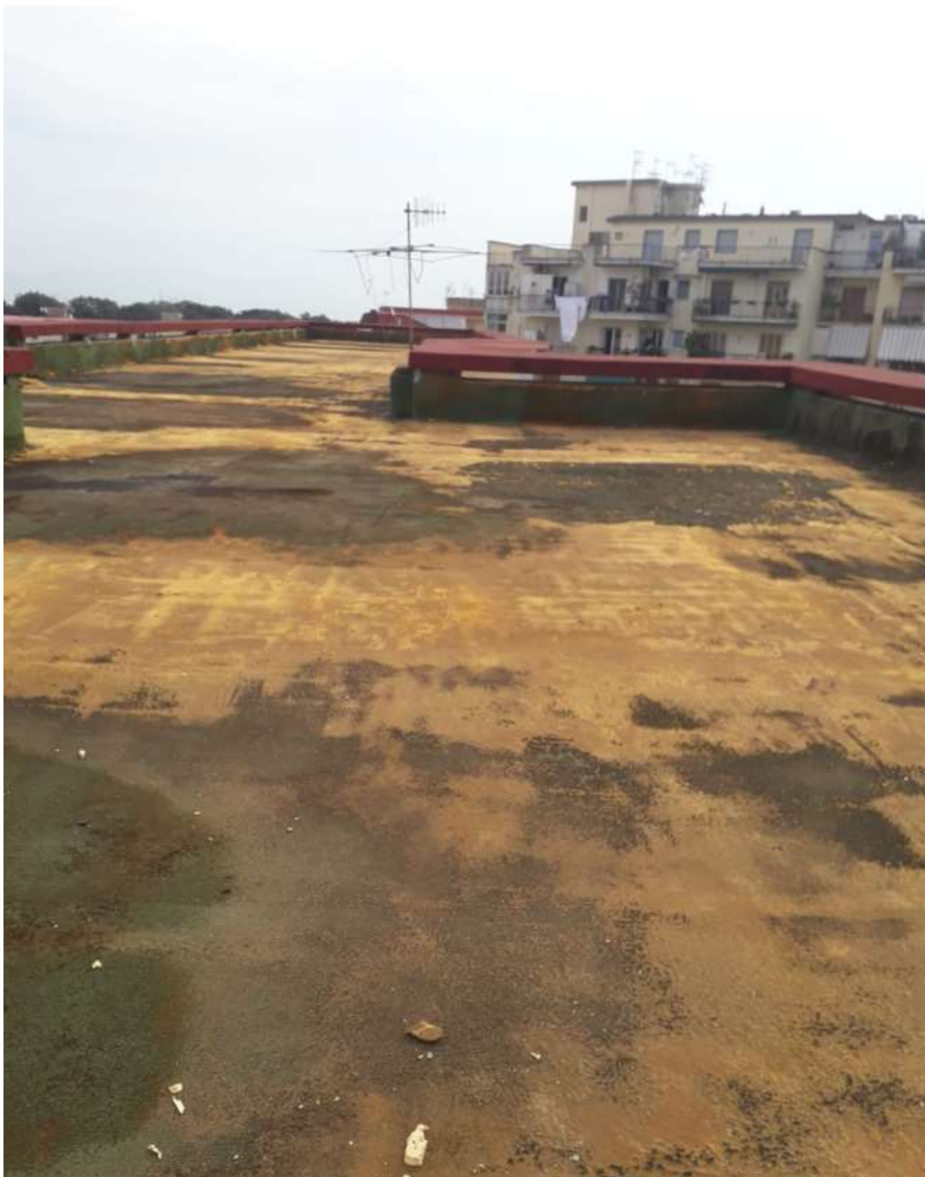
foto n.4 Stato di fatto -Copertura dell'edificio scolastico