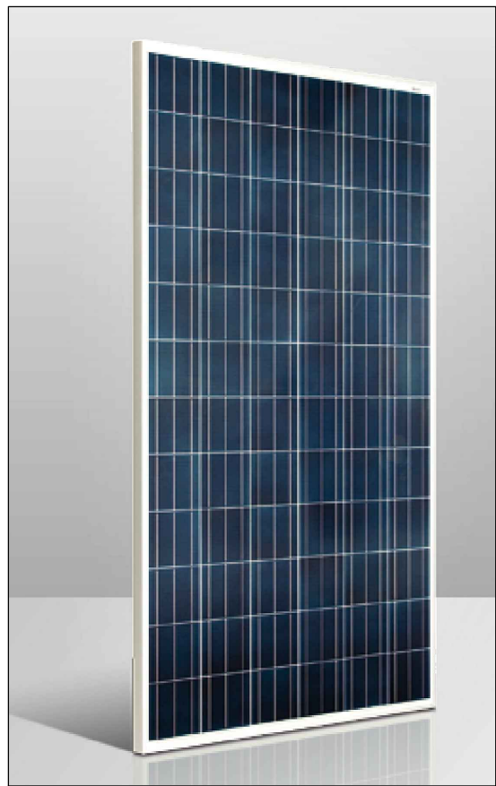
MODULO FOTOVOLTAICO DA 300 Wp - CONERGY PE 300P