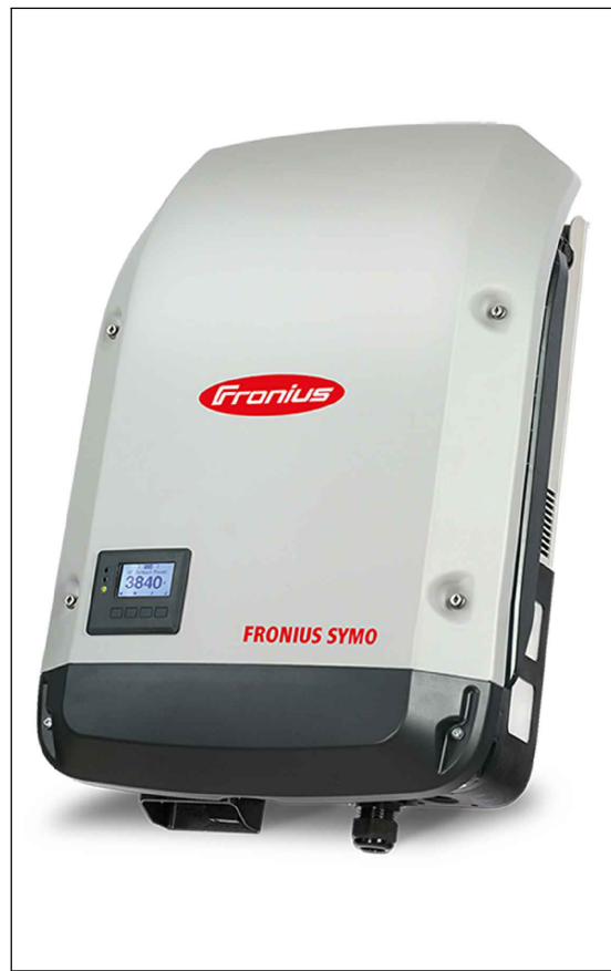
INVERTER DA 600 W - FRONIUS SYSMO 6.0-3-M