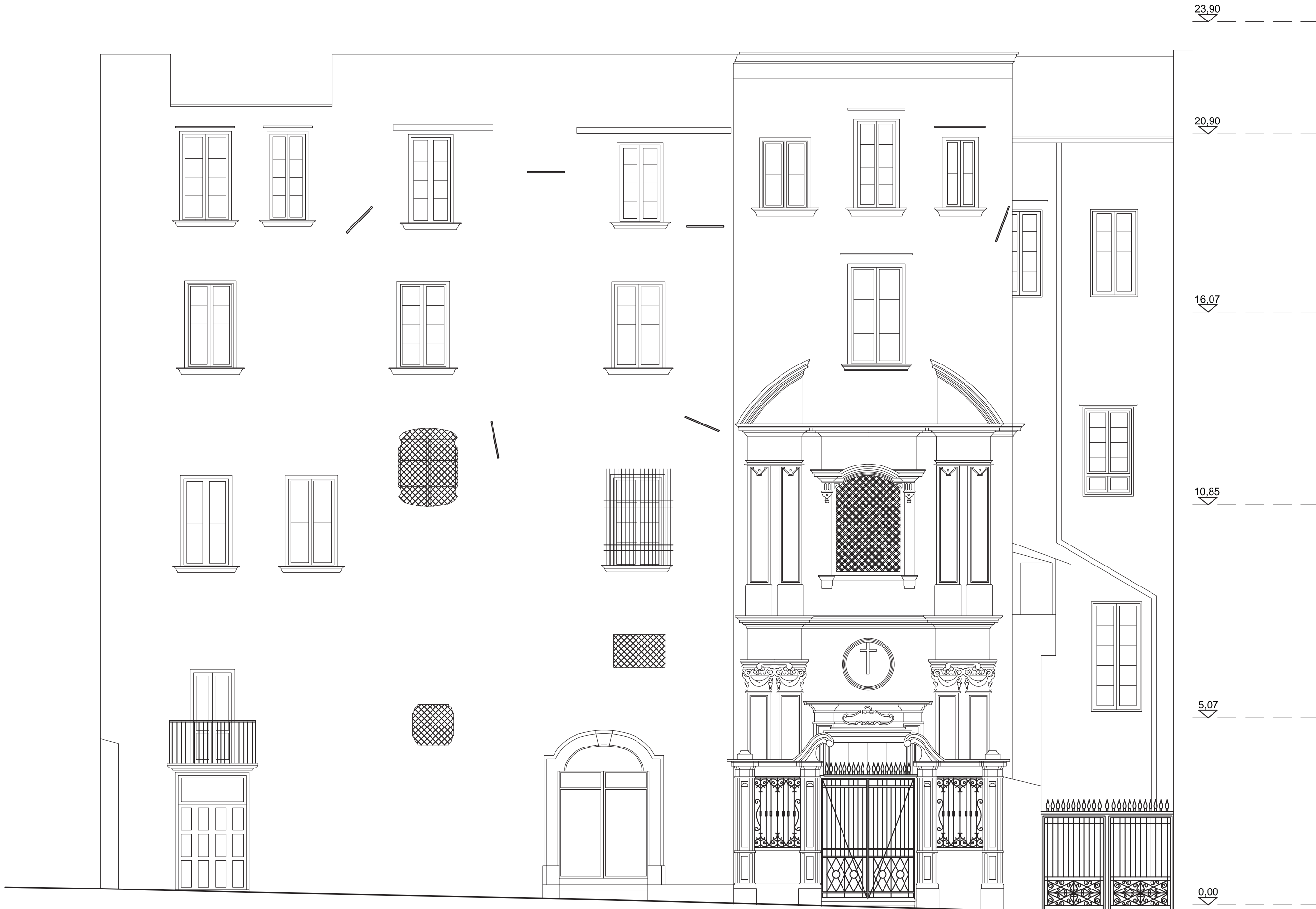
Prospetto su vico Cinquesanti