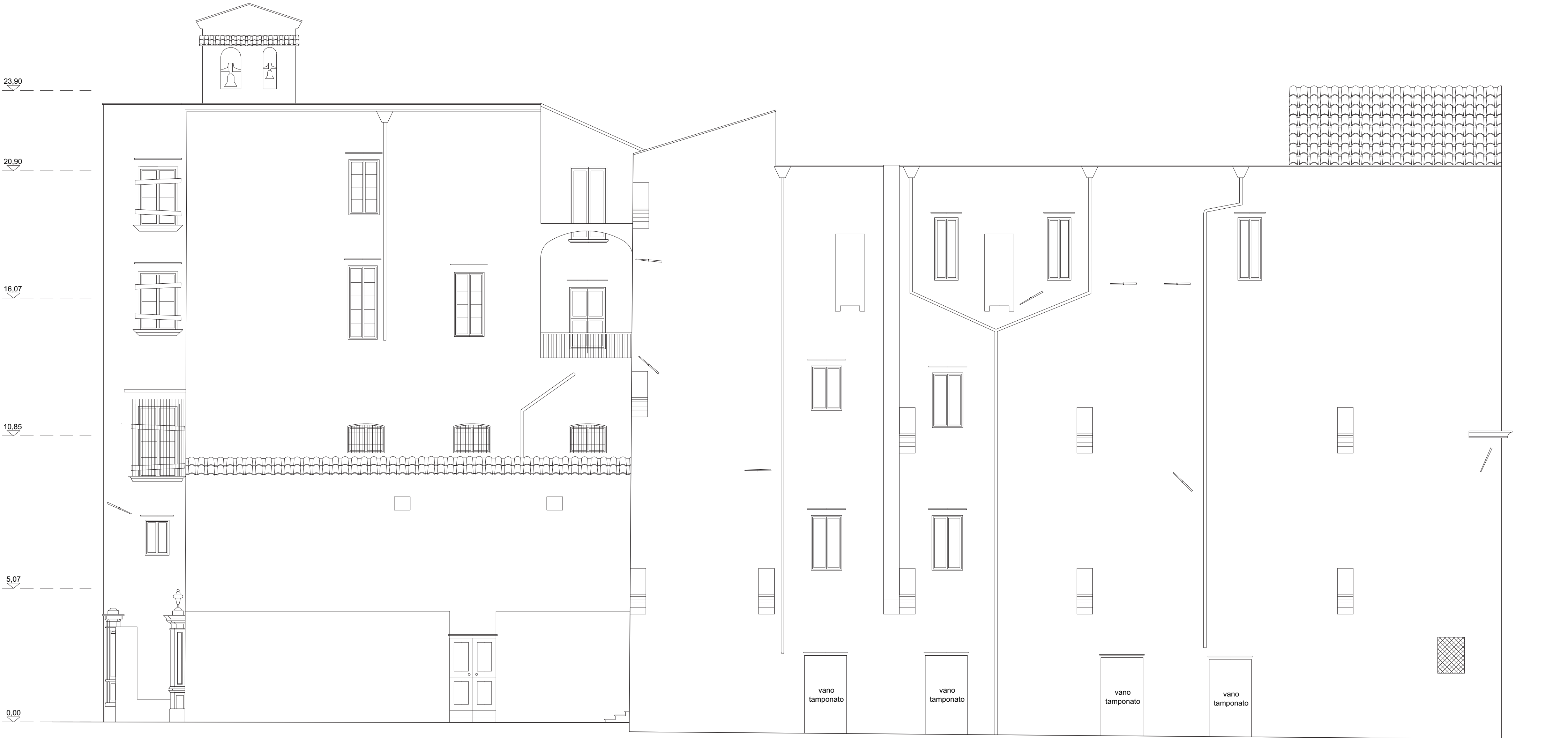
Prospetto su vicoletto Scorziata