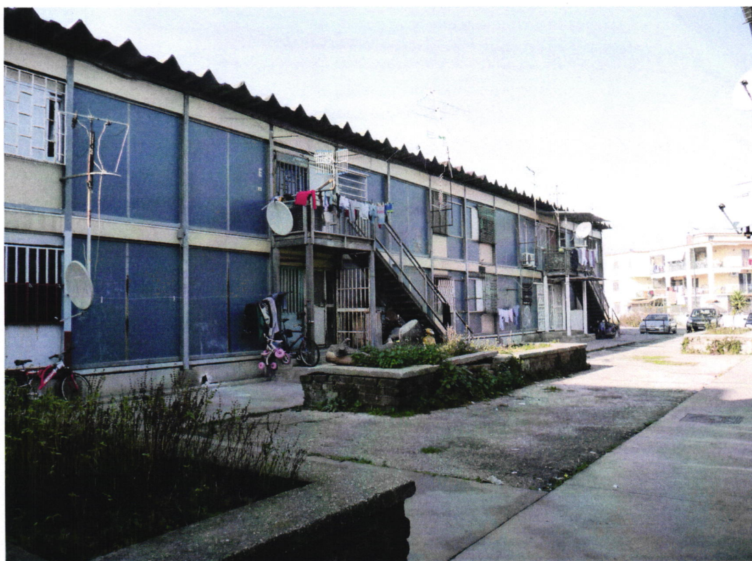
FACCIATA POSTERIORE CON SUPERFETAZIONI