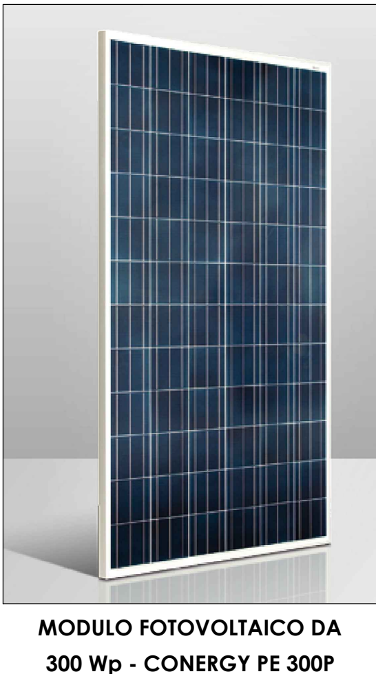
MODULO FOTOVOLTAICO DA 300 Wp - CONERGY PE 300P