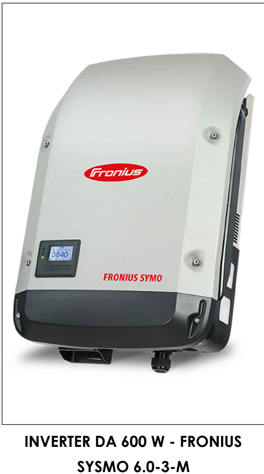
INVERTER DA 600 W - FRONIUS SYMO 6.0-3-M