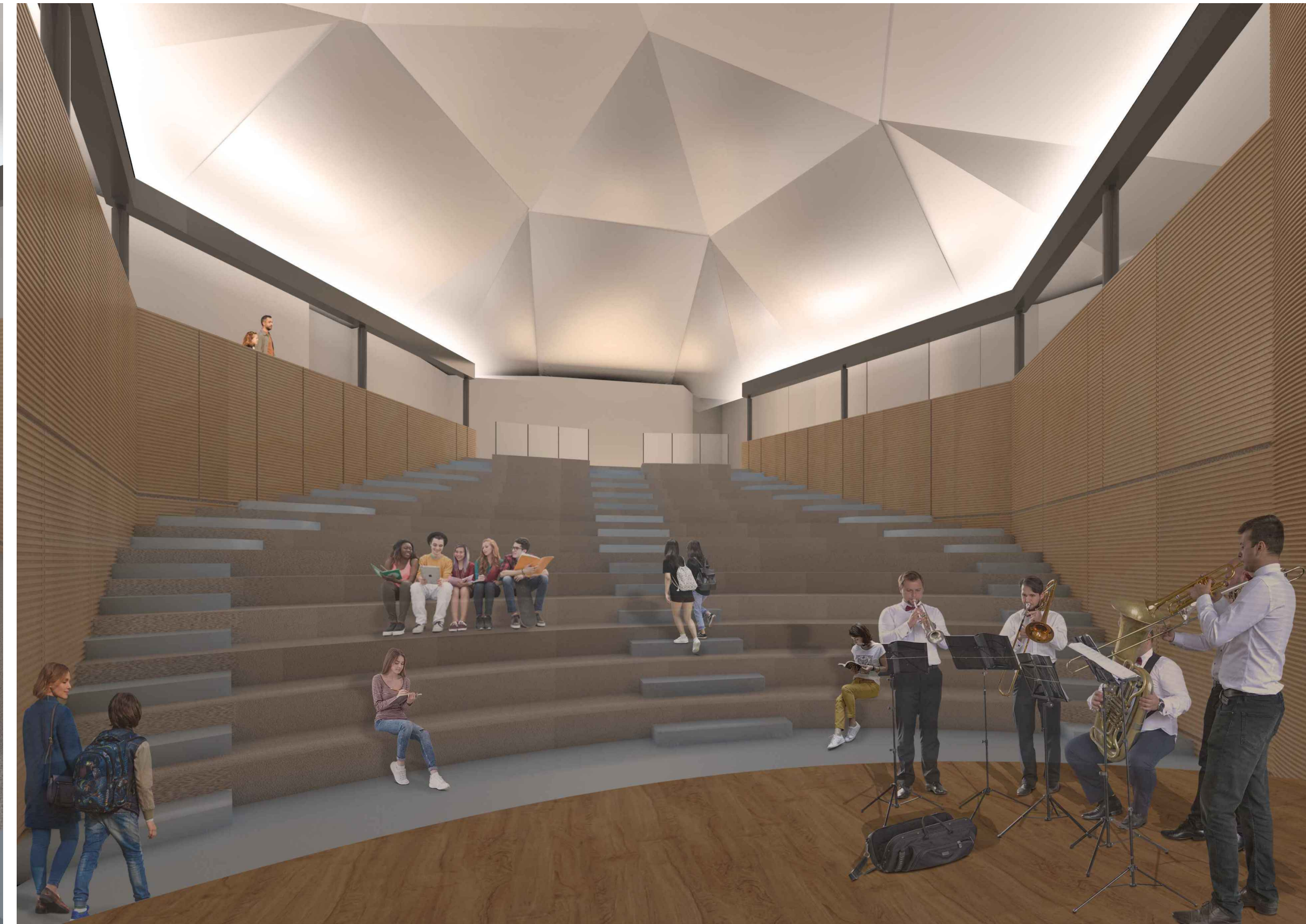
Vista interna palco