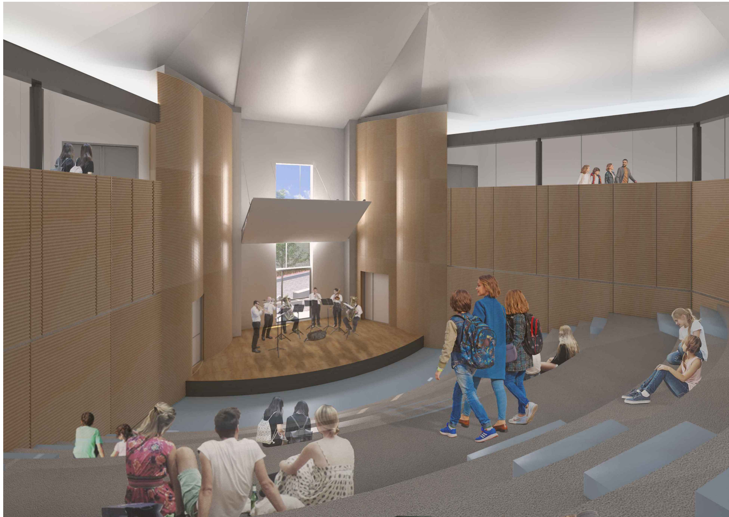
Vista interna spalti