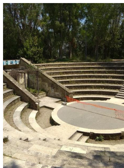
Manifestazioni di degrado puntuale della fontana principale, della pensilina dell'area di sosta e dello spazio eventi