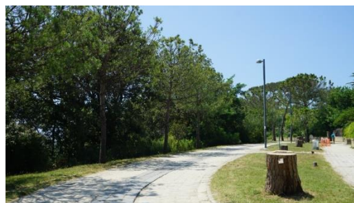
Viali interni al parco

Le aree attrezzate risultano ben dimensionate rispetto alla superficie del parco e opportunamente differenziate. Sono presenti infatti aree per il gioco dei bambini, per la sosta, per lo sport, per lo svago, per gli eventi e gli spettacoli.