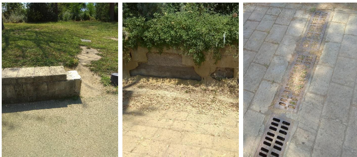
Fenomeni di degrado dei muretti in tufo e ostruzione delle caditoie dovuta all'assenza di manutenzione

I sistemi di delimitazione, protezione e contenimento sono realizzati prevalentemente con materiali di provenienza locale, a basso impatto e compatibili con l'ambiente (tufo e legno). Sono presenti manifestazioni di degrado puntuali che riguardano i muretti in tufo realizzati senza bauletto.