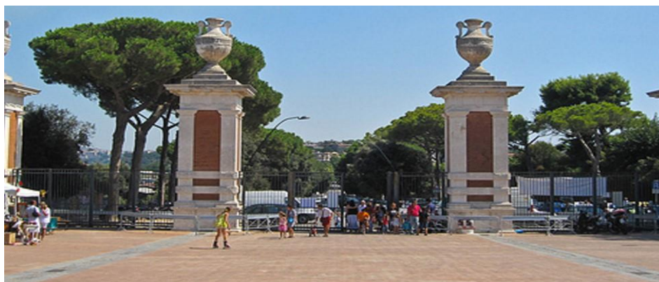
Ingresso da viale Virgilio

Il parco Virgiliano è, fra i parchi napoletani, uno fra i più suggestivi per gli aspetti paesaggistici e naturalistici, per la sua collocazione in una condizione di particolare bellezza, affacciato sul mare in una propaggine di Capo Posillipo. Il parco può essere raggiunto utilizzando prevalentemente linee di trasporto pubblico su gomma. La presenza del parco all'interno del contesto urbano è adeguatamente segnalata e anticipata dalla presenza di un'area contigua opportunamente naturalizzata. Esistono due ingressi di cui quello principale collocato a ridosso di un'area destinata a parcheggio pubblico.