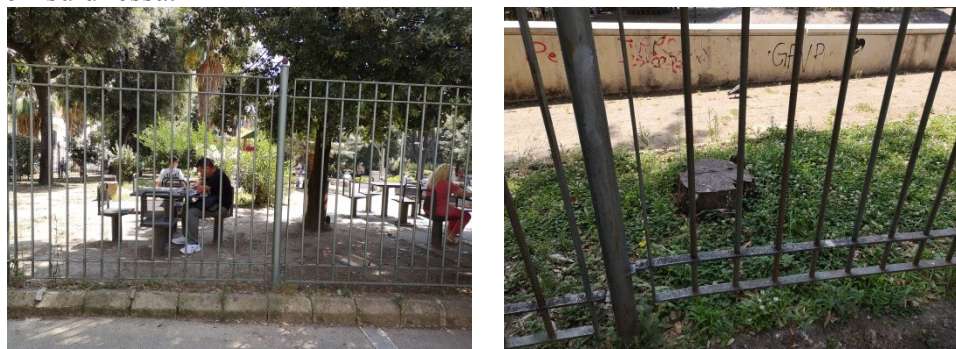
La recinzione perimetrale

La recinzione metallica perimetrale presenta piccoli e localizzati danni dovuti probabilmente a caduta di alberi su di essa.