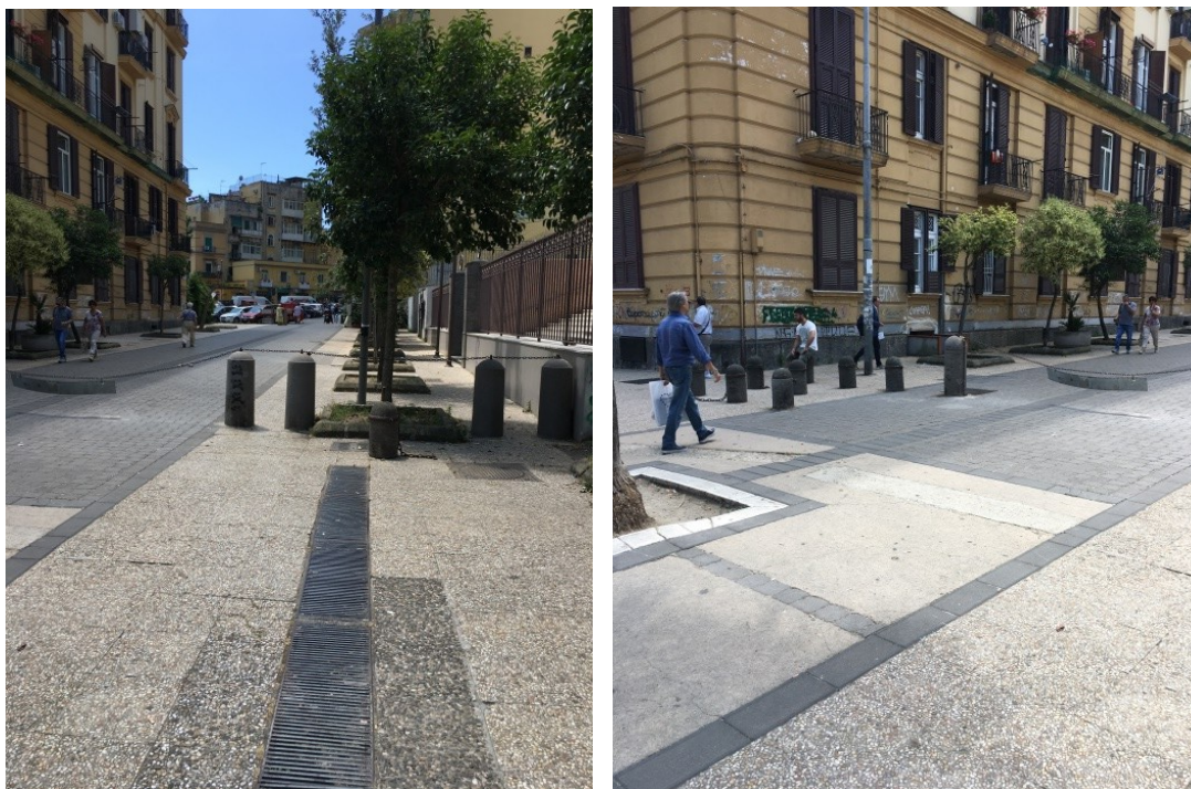
Via Gianbattista Ruoppolo

All'interno, nell'area recintata, sono presenti aree a verde e pavimentate (battuto di tufo, calcestruzzo, cubetti di porfido, prato sintetico), oltreché percorsi che conducono alle varie aree di svago come l'area giochi, un percorso vita, una giostra per disabili, un campo di bocce e un campo di basket. Vi sono, inoltre, installazioni artistiche, una fontana, pergolati, tavoli e panche per la sosta. È presente anche un grande volume che include locali tecnici, locali per il personale e bagni per il pubblico.