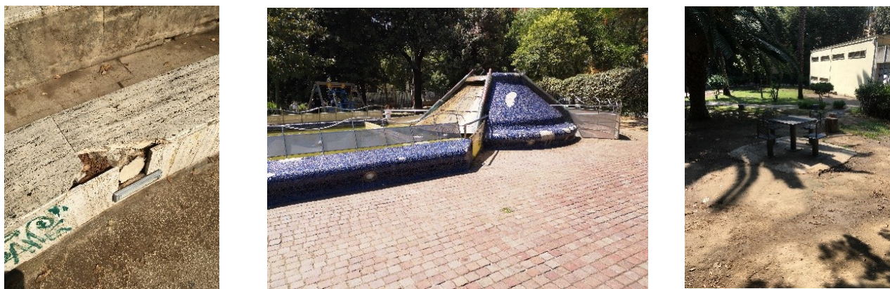
Le differenti tipologie di pavimentazione

I sistemi di delimitazione, protezione e contenimento sono realizzati prevalentemente con materiali di provenienza locale, a basso impatto e compatibili con l'ambiente (tufo); questi ultimi risultano in parte danneggiati, generando in alcuni casi pericolo per la sicurezza degli utenti.