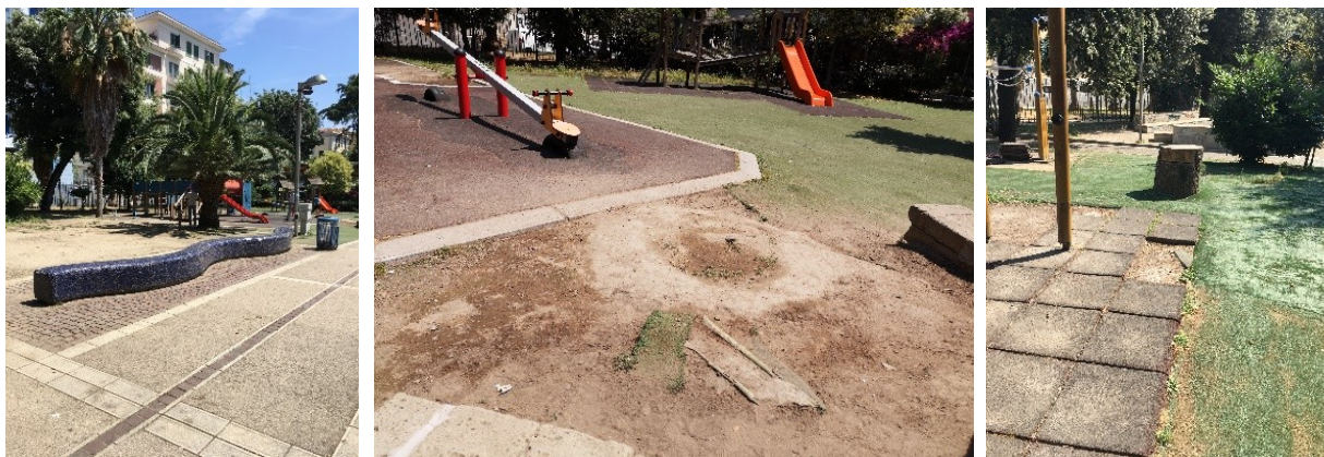
Le differenti tipologie di pavimentazione

I sistemi di delimitazione, protezione e contenimento sono realizzati prevalentemente con materiali di provenienza locale, a basso impatto e compatibili con l'ambiente (tufo); questi ultimi risultano in parte danneggiati, generando in alcuni casi pericolo per la sicurezza degli utenti.