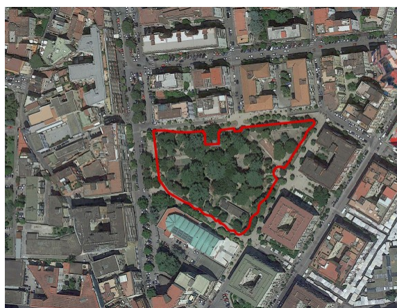
Evoluzioni storiche anni: 1943 e 2013

Il parco, a pianta trapezoidale, presenta quattro ingressi, il principale è situato su Via Gianbattista Ruoppolo, gli altri si affacciano su aree attrezzate con panchine in legno, aiuole e attrezzature per lo sport.