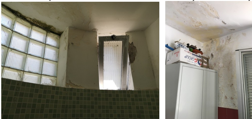
Servizi igienici e locale per il personale

I servizi igienici, così come i locali del personale, sono collocati all'interno del volume situato al centro del parco, questi presentano diverse problematiche di infiltrazioni d'acqua dovuti ad un'inadeguatezza dell'impermeabilizzazione dell'involucro oltreché a problematiche impiantistiche.