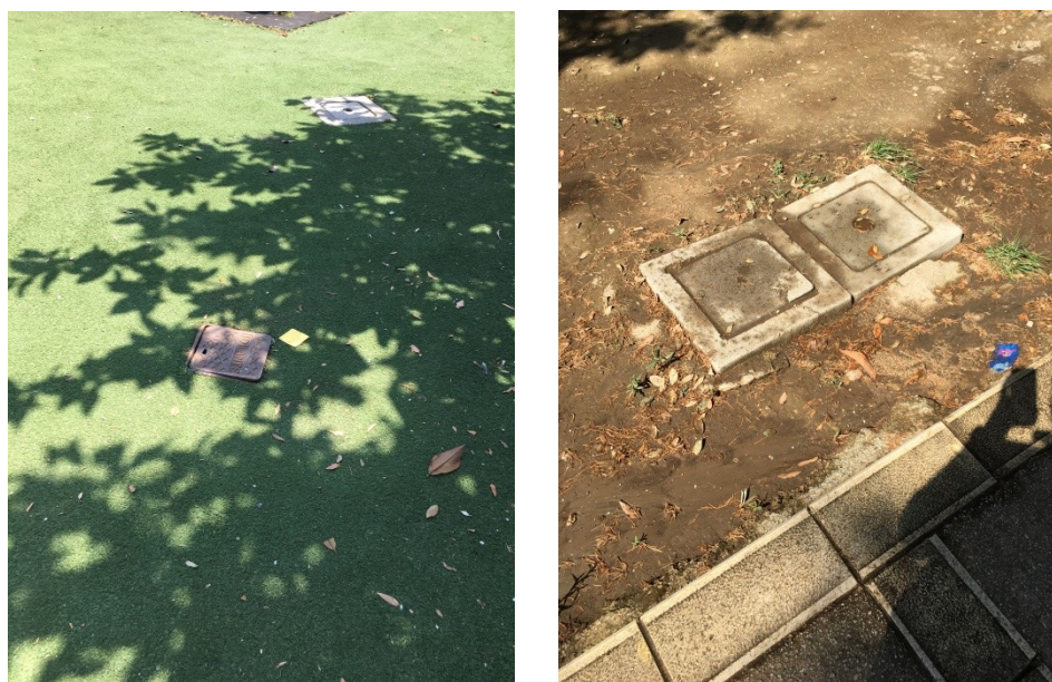
Particolare dei tombini

I vari tombini dislocati delle aree a verde risultano essere sovraesposti alla quota del terreno generando condizioni di forte pericolo per gli utenti favorendo fenomeni di inciampo.