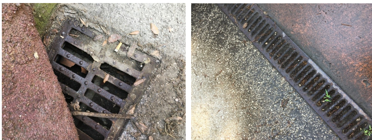
Particolari delle caditoie

Il sistema di smaltimento delle acque meteoriche presenta alcune condizioni di degrado ricorrenti: le caditoie risultano spesso ostruite dal terreno a causa, probabilmente, di una non frequente manutenzione.