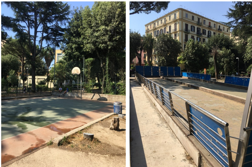
Il campo da basket e il campo da bocce

Il parco è dotato di un campo da bocce in discrete condizioni, ma totalmente inutilizzato, è deducibile il disinteresse dell'utenza a tale attività di svago, contrariamente sono presenti aree di sosta semicoperte attrezzate con tavoli e panche fortemente utilizzati soprattutto dagli anziani.