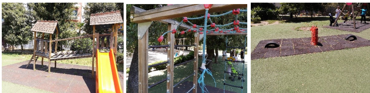
Area giochi attrezzata

L'area giochi risulta essere l'area fortemente usurata e danneggiata dell'intero parco, qui molte delle giostrine risultano essere interdette al pubblico a causa di danni, mancanze e quindi condizioni di forte pericolo soprattutto per i bambini.