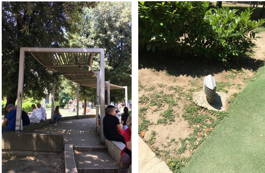
Il pergolato metallico e un punto illuminante

Nella parte centrale al parco, il pergolato metallico con copertura in listelli di legno, presenta danni parziali soprattutto di distacco.